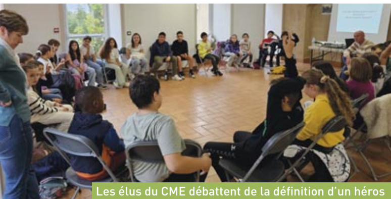
Les élus du CME débattent de la définition d'un héros

Ces deux jours ont permis aux élus de faire connaissance à travers diverses activités de coopération, de découverte de la citoyenneté et du rôle d'élus. Ils ont pu échanger avec le maire, les élus municipaux et les anciens élus du CME.