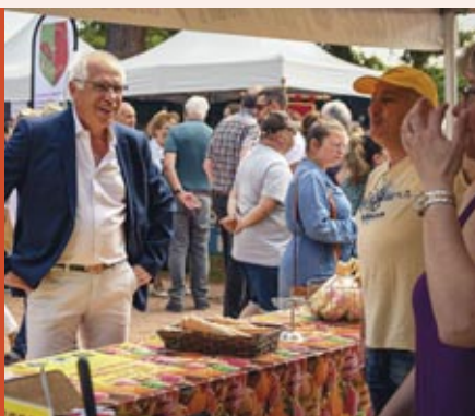
Fête des fleurs et des produits du terroir, les 21 et 22 mai.