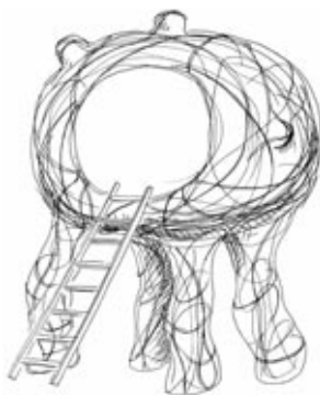
"BOUBA", œuvre coup de cœur du Conseil Municipal Enfants.

Le parcours d'art actuel À Ciel Ouvert est de retour !