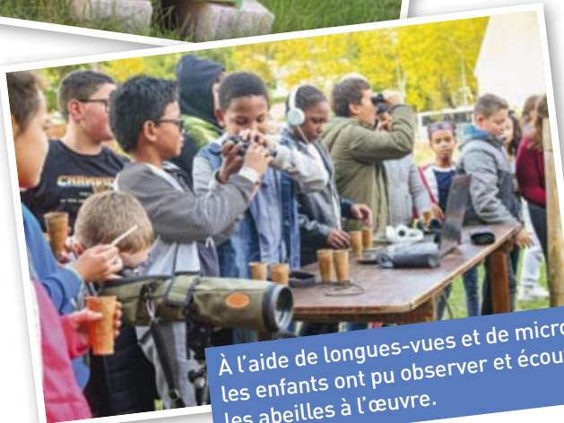
À l'aide de longues-vues et de micros, les enfants ont pu observer et écouter les abeilles à l'œuvre.

Au cours de l'hiver 2019, des animateurs de la Ligue de l'Enseignement ont réalisé des interventions dans les classes des quatre écoles élémentaires de la commune. Les enfants ont découvert l'intérêt de la biodiversité et notamment l'importance de la présence des abeilles, primordiale pour la préservation de celle-ci.