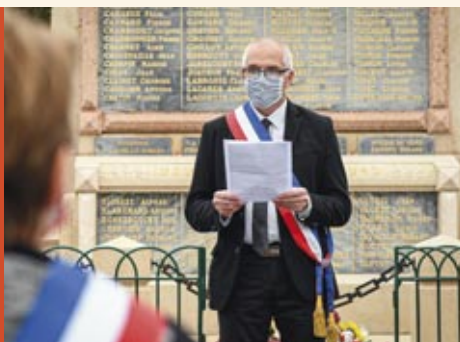
Cérémonie de commémoration du 11 novembre.