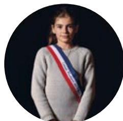
Thes Aubert École de Beaucueil - CM2