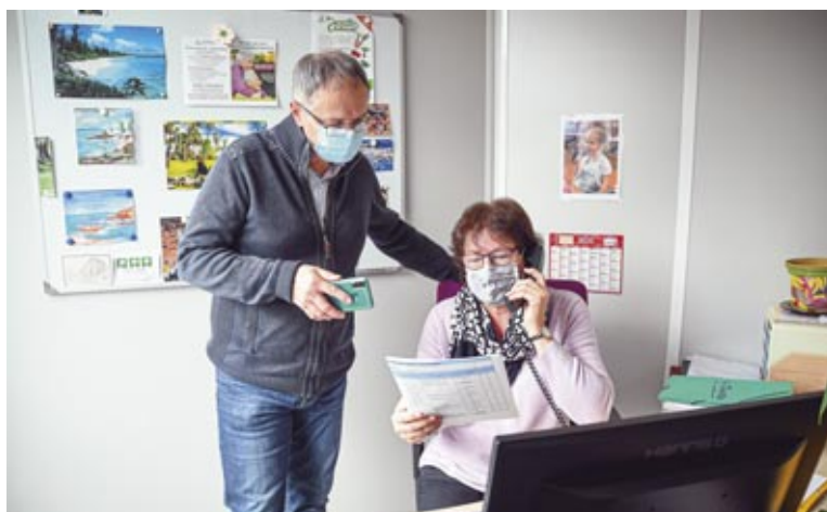
Les agents du CCAS contactent les personnes isolées par téléphone afin de s'assurer que tout va bien.

Un nouveau confinement a débuté le 30 octobre. L'Hôtel de Ville reste ouvert aux horaires habituels, la continuité du service public est assurée par l'ensemble des services municipaux.