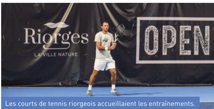
Les courts de tennis riorgéois accueillent les entraînements.

La Ville de Riorges était partenaire de la deuxième édition de l'Open de Roanne, Auvergne Rhône-Alpes, qui se tenait du 7 au 13 novembre au Scarabée.