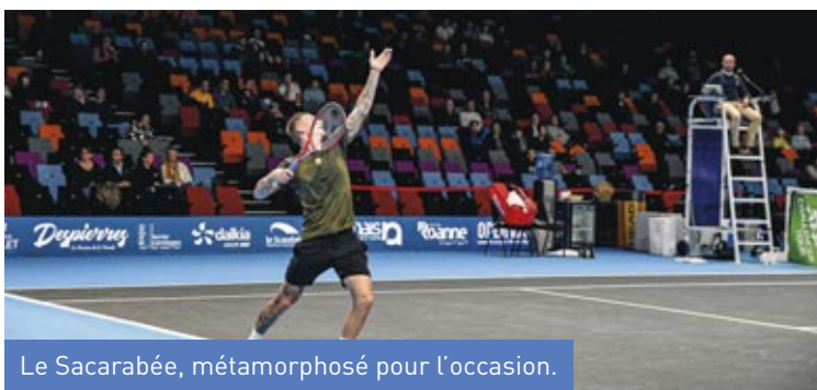
Le Sacarabée, métamorphosé pour l'occasion.