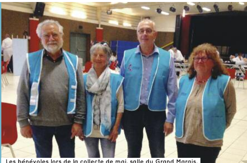
Les bénévoles lors de la collecte de mai, salle du Grand Marais.

CHAQUE JOUR, 10 000 DONS DE SANG SONT NÉCESSAIRES POUR RÉPONDRE AUX BESOINS. RIORGES ACCUEILLE DEUX COLLECTES PAR AN. POUR EN FACILITER LA PROMOTION ET L'ORGANISATION, UNE SECTION RIORGEOISE DE L'ASSOCIATION DES DONNEURS DE SANG VIENT DE VOIR LE JOUR.