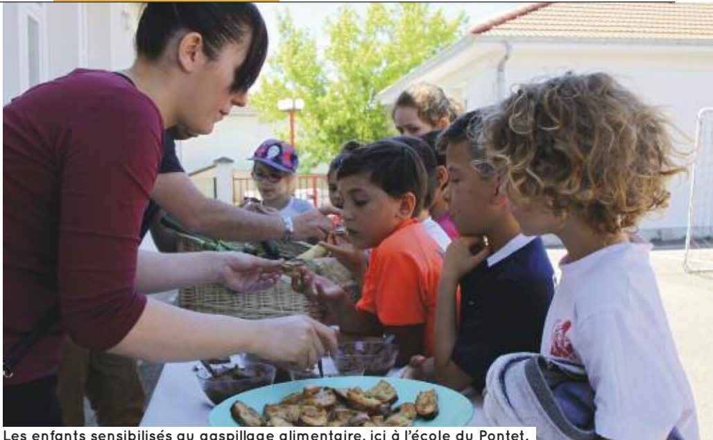
Les enfants sensibilisés au gaspillage alimentaire, ici à l'école du Pontet.