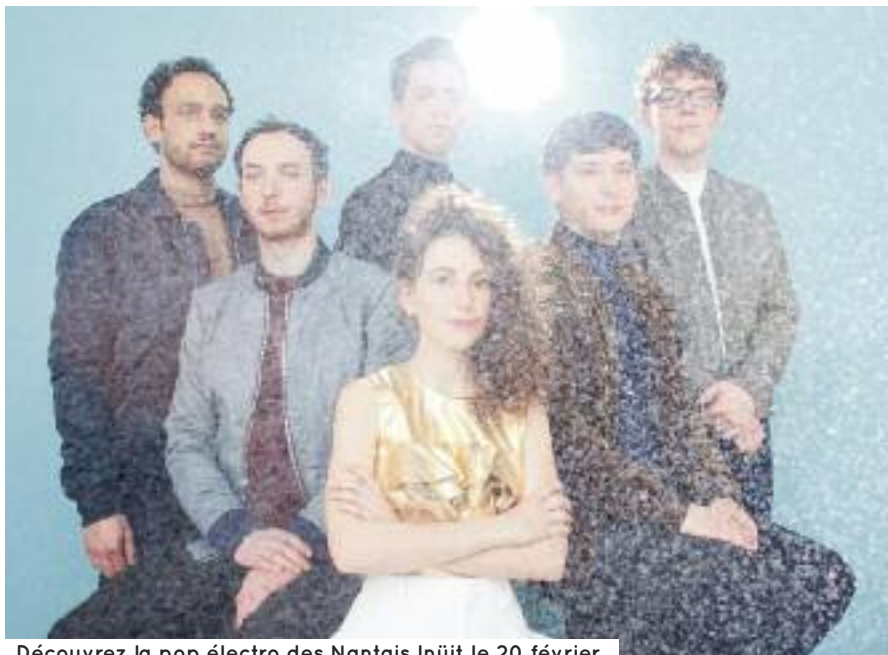
Découvrez la pop électro des Nantais Inüit le 20 février.