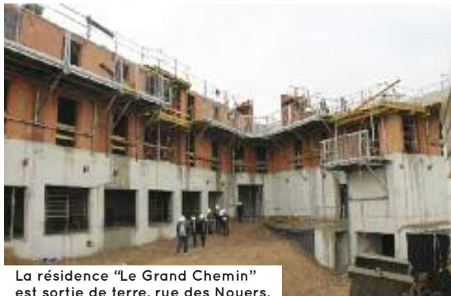
La résidence "Le Grand Chemin" est sortie de terre, rue des Noyers.

LA MUNICIPALITÉ S'ENGAGE POUR LA CRÉATION DE LOGEMENTS, ET NOTAMMENT POUR ATTEINDRE L'OBJECTIF DE 20% DE LOGEMENTS LOCATIFS AIDÉS. À SES CÔTÉS, LE BAILLEUR SOCIAL OPHÉOR, QUI MÈNE ACTUELLEMENT DEUX CHANTIERS DE CONSTRUCTION DE RÉSIDENCES : « LE GRAND CHEMIN » AU PONTET ET « RIVES SUD », À PROXIMITÉ DU COLLÈGE.