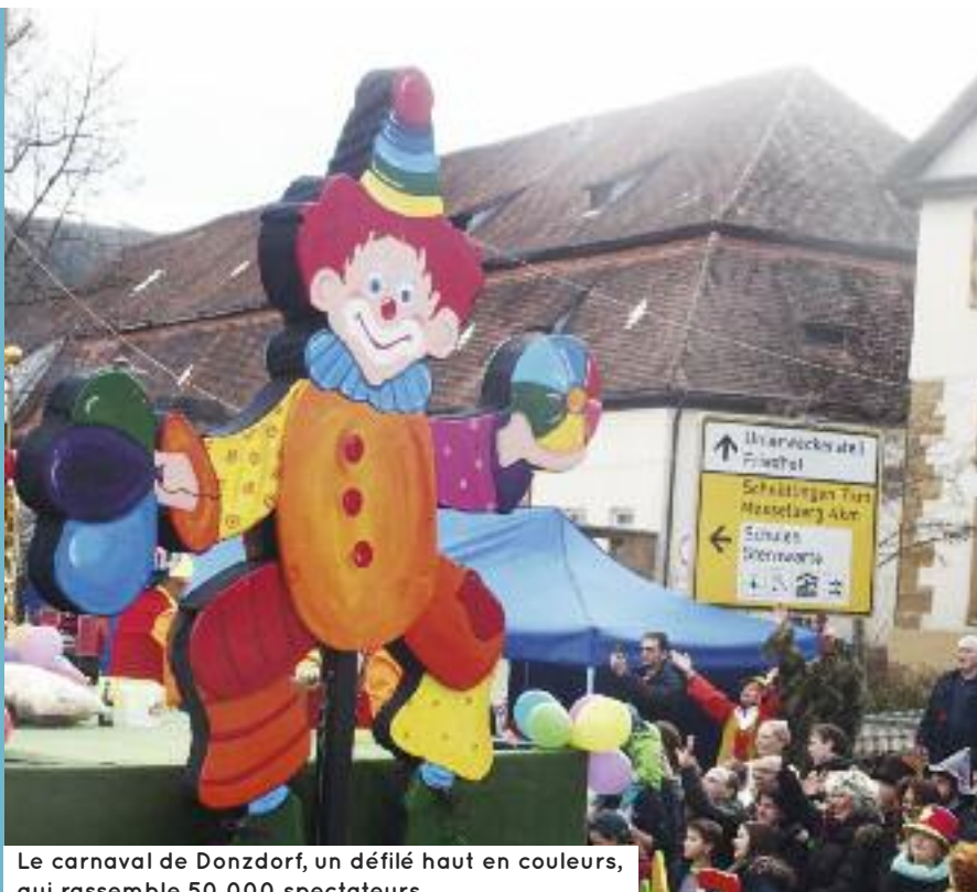
Le carnaval de Donzdorf, un défilé haut en couleurs, qui rassemble 50 000 spectateurs.

2018 SERA UNE ANNÉE RICHE POUR LE COMITÉ DE JUMELAGE : ELLE DÉBUTERA AVEC LE TRADITIONNEL VOYAGE AU CARNAVAL DE DONZDORF ET SERA AUSSI CELLE DU 40 E ANNIVERSAIRE AVEC ELLAND.