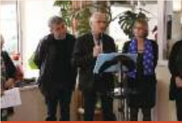
La résidence Quiétude organisait sa fête de Noël le 13 décembre.