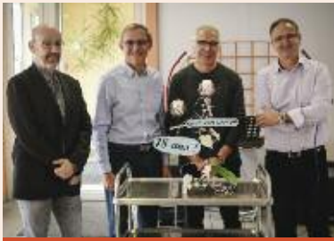
Le foyer Pierre Laroque a fêté ses 18 ans !