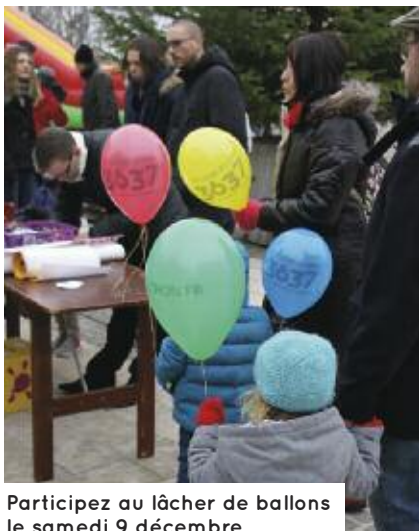
Participez au lâcher de ballons le samedi 9 décembre.