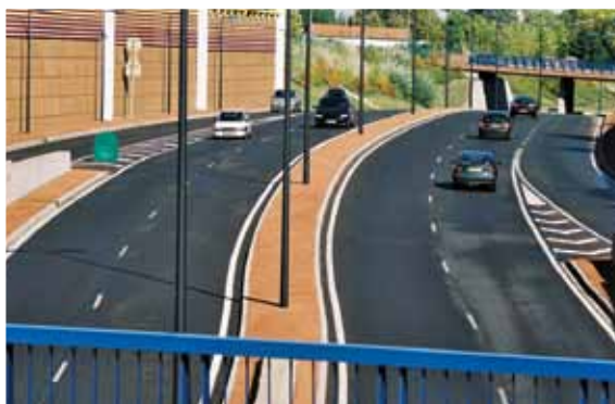
Un règlement de publicité protège notre environnement de la pollution dite 'visuelle'. Le boulevard Ouest, vierge de tout panneau, est une voie urbaine au paysage apaisé.