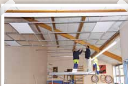
Travaux d'isolation thermique à la maternelle de Beaucueil pour limiter les déperditions de chaleur.