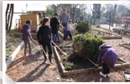
Les écoliers riorgeois entretiennent et cultivent leur jardin de Simples* sous les conseils des services municipaux qui les sensibilisent à la protection de la biodiversité.

Vous pouvez accéder aux services de la médiathèque de Roanne, au même prix que les Roannais, la ville se charge de payer la différence. Rejoignez les 500 personnes déjà inscrites !