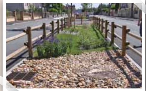
La première noue paysagère et végétalisée, réalisée rue du Docteur Calmette, récupère et filtre naturellement les eaux de pluie, notamment les eaux sales qui ruissellent de la route. D'autres noues et puits filtrants sont installés progressivement sur la commune.

Rappelez-vous, en 1977, deux crues importantes, les 26 mai et 31 juillet, ont engendré de nombreux dégâts dans les habitations. Depuis, une dizaine de millions d'euros ont été investis dans des travaux pour que de telles catastrophes ne se reproduisent plus.