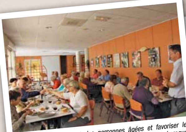
Lutter contre l'isolement des personnes âgées et favoriser le maintien à domicile sont des priorités. Le foyer Pierre Laroque accueille les retraités et personnes porteuses de handicap qui souhaitent déjeuner.