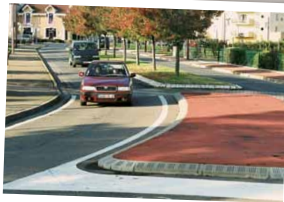
En 1982, le chemin du Fourgon a laissé place à la rue Léon-Blum, colonne vertébrale de Riorges Centre.