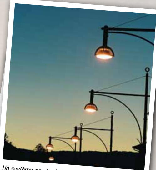
Un système de régulation de l'éclairage public permet de réaliser des économies d'énergie.