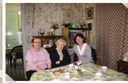
Le travail du réseau de bénévoles apporte réconfort, considération et affection aux personnes dépendantes et isolées.

Payer ses impôts est un acte de solidarité, comme l'indique l'article 13 de la Déclaration des droits de l'homme et du citoyen : « Pour l'entretien de la force publique et pour les dépenses d'administration, une contribution commune est indispensable : elle doit être également répartie entre tous les citoyens, en raison de leurs facultés ».