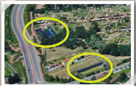
Des bassins tampons récoltent les eaux pluviales le long du boulevard Ouest.