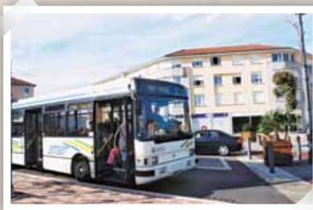
Vélo, bus, marche à pieds..., pour se déplacer, les alternatives au véhicule particulier sont économes et moins polluantes.