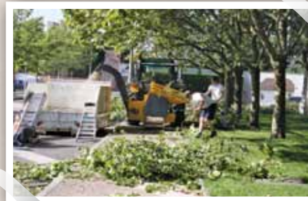
Les déchets verts sont broyés sur place. Cette valorisation diminue le volume des déchets à incinérer et limite les transports.

Les feuilles mortes ramassées à l'automne par le service Cadre de vie sont données aux agriculteurs : mélangées avec du fumier, elles deviennent un engrais naturel.