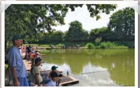
Le plan d'eau du Combray reçoit des eaux pluviales filtrées, nettoyées des hydrocarbures présents sur les chaussées. Place aux amateurs de pêche !