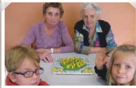
De nombreux échanges intergénérationnels ont lieu régulièrement entre les différentes structures sociales. Des « petits enfants » et des « grands parents » réunis le temps d'une rencontre, autour d'une activité, partagent leur gaieté, leurs sensations, leurs émotions...