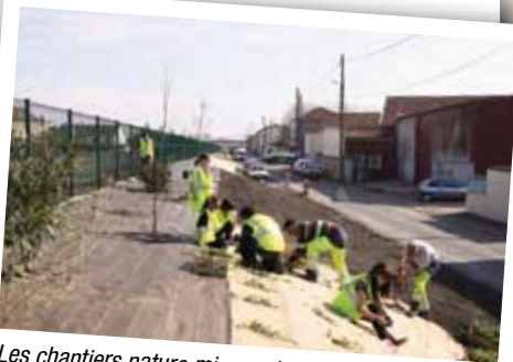
Les chantiers nature mis en place par la municipalité favorisent l'engagement citoyen de jeunes collégiens et les sensibilisent au développement durable.