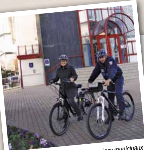
Le vélo a pignon sur rue pour les services municipaux !