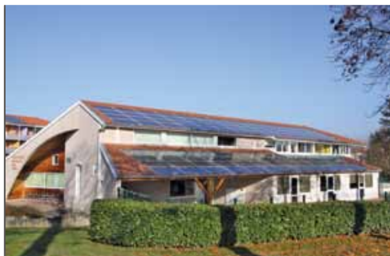
Bienvenue à l'énergie « verte » ! En partenariat avec le Syndicat intercommunal d'énergies du département de la Loire (Siel), des panneaux photovoltaïques ont été mis en place sur le toit du centre social. Cette électricité produite grâce à la lumière est reversée dans le réseau, diminuant ainsi le recours à de l'électricité issue des énergies fossiles, sources de CO2.