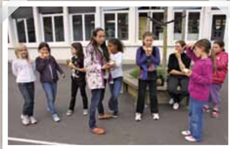
L'action "un fruit pour la récré" contribue à l'éducation au goût, à la santé et à l'envie du "mieux manger"... Une sensibilisation aux bonnes habitudes alimentaires, capitale dès le plus jeune âge !