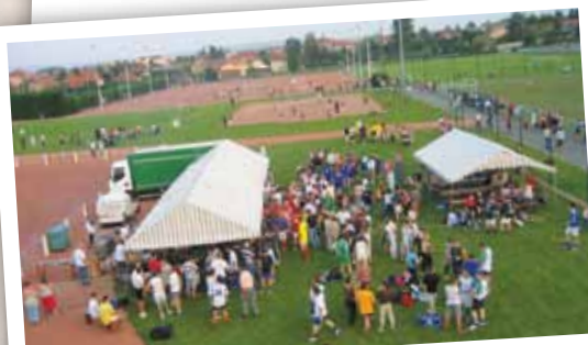
Une bonne santé c'est déjà une bonne condition physique : la forme s'entretient au parc sportif Galliéni, au complexe sportif Léo Lagrange et sur le parcours de santé le long du Renaison.