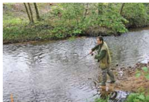
Grâce à la qualité de l'eau, « la truite vagabonde » dans le Renaison.