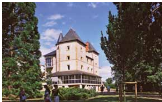
Dans un écrin de verdure, le château de Beaulieu, offre un espace apprécié des artistes et des visiteurs. Ce patrimoine architectural et socioculturel, sauvé par la municipalité d'une opération immobilière en 1977, est à entretenir et à préserver, pour que ce lieu public, bien collectif qui appartient à tous, serve aux futures générations, encore longtemps.