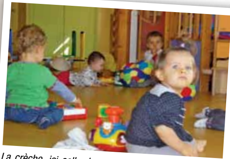
La crèche, ici celle des P'tits Mikeys, est un service soutenu par la Caisse d'allocations familiales pour que les soucis de garde des plus petits ne soient pas un frein à la maternité.