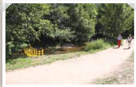
Grâce aux cheminements piétonniers et modes doux, chacun peut se balader en toute quiétude dans un cadre champêtre.