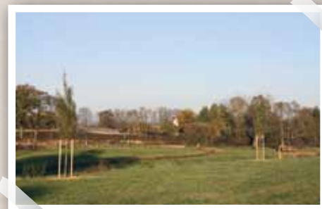
Le corridor biologique et écologique du vallon du Combray favorise la biodiversité et offre des lieux de promenades au cœur de la cité.

La commune compte 40 km d'itinéraires de randonnée et prend part au schéma départemental des itinéraires de randonnées mis en place par le conseil général.