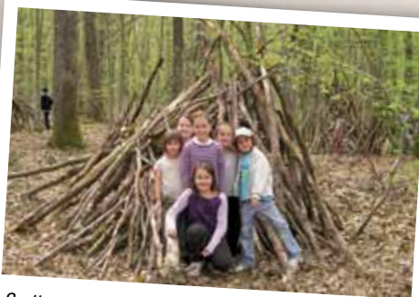
Sorties nature, jeux et découvertes pour les enfants du centre de loisirs.