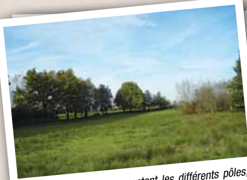
Les liaisons douces connectent les différents pôles, à travers une trame verte et bleue.