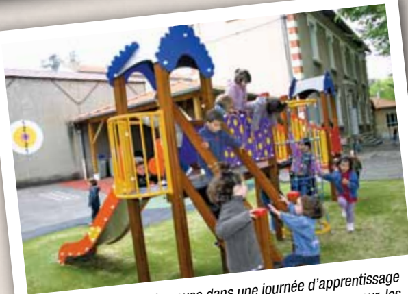
Parce que les temps de pause dans une journée d'apprentissage sont très importants pour les jeunes écoliers comme pour les enseignants, les espaces de récréation ludiques et naturels sont soignés dans les cours des quatre groupes scolaires.