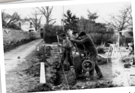
Avant 1982, le chemin du Fourgon ne menait pas plus loin que le cimetière !