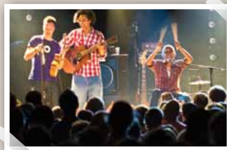
La jeunesse roannaise, et plus si affinité musicale, se donne rendez-vous aux Mardi(s) du Grand Marais.