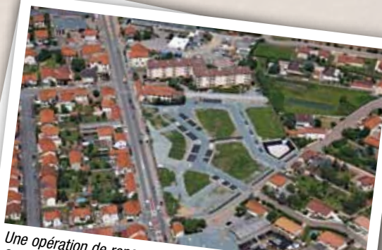
Une opération de renouvellement urbain, dénommée Pontet 2010, restructure le quartier du Pontet, vieillissant : son identité est renforcée et son cadre de vie amélioré.