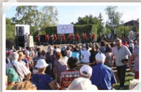
Le parc du Pontet est un des six parcs communaux, espaces de détente et de loisirs, mais aussi lieux de rencontres et de festivités.