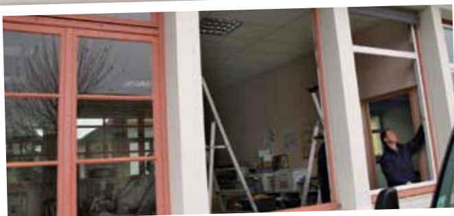
À l'école du Pontet, comme dans tous les autres groupes scolaires, les huisseries ont été changées pour une meilleure isolation des salles de classe. En hiver, moins de déperdition de chaleur, c'est moins de gaspillage d'énergie. En été, moins de chaleur, c'est plus agréable pour étudier.