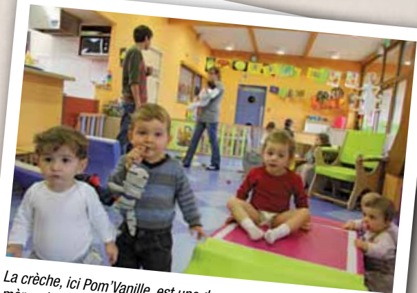
La crèche, ici Pom'Vanille, est une des solutions pour permettre aux mères de conserver leur emploi et ainsi encourager l'égalité professionnelle entre les femmes et les hommes.