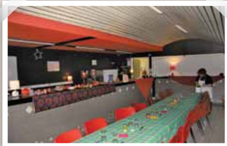
L'association pour le maintien d'une agriculture paysanne et biologique (Amap) privilégie les producteurs locaux pour les repas des artistes et du personnel.