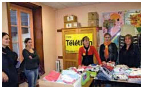
La solidarité se décline aussi à travers la mobilisation des associations dans des causes humanitaires, comme par exemple depuis une quinzaine années, pour le Téléthon.