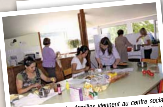
Une fois par mois, des familles viennent au centre social pour partager des « ateliers cuisine ». C'est à la fois un temps pour découvrir et apprendre, échanger, se rencontrer et sympathiser.