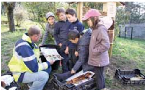
Par l'organisation et l'animation d'ateliers pédagogiques, le service cadre de vie s'investit dans l'éducation des enfants pour la protection de notre environnement.