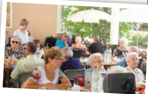
La résidence Quiétude, un lieu où l'on soigne, un lieu de vie spécialement adapté aux personnes âgées dépendantes.