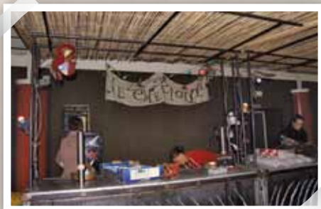
Des associations et des entreprises intermédiaires sont associées à chaque concert. Ici le Zèbre étoilé tient la buvette.