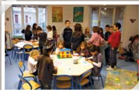
La gratuité de la garderie en école primaire est un choix politique.