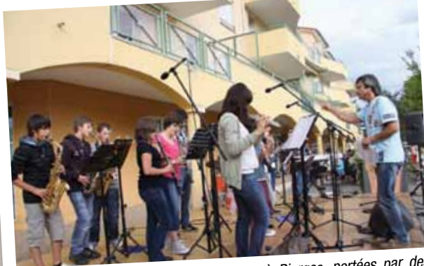
La qualité et la quantité d'associations à Riorges, portées par des bénévoles investis et motivés, constituent un véritable vivier d'activités sportives, culturelles, sociales et de loisirs. Un habitant sur trois est adhérent à une association locale. Ici le centre musical Pierre Boulez lors de la Fête de la musique.