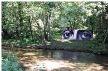
Riorges, ville curieuse et ouverte, fait aussi une place au Land'art*. Les artistes puisent leur inspiration dans la nature pour un parcours artistique au bord du Renaison.