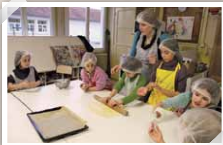
L'éducation des enfants, au sens le plus large du terme, est une priorité municipale concrétisée par le projet éducatif local. Ce dispositif de moyens humains et matériels offre un panel d'activités très variées pour l'enfance et la jeunesse.