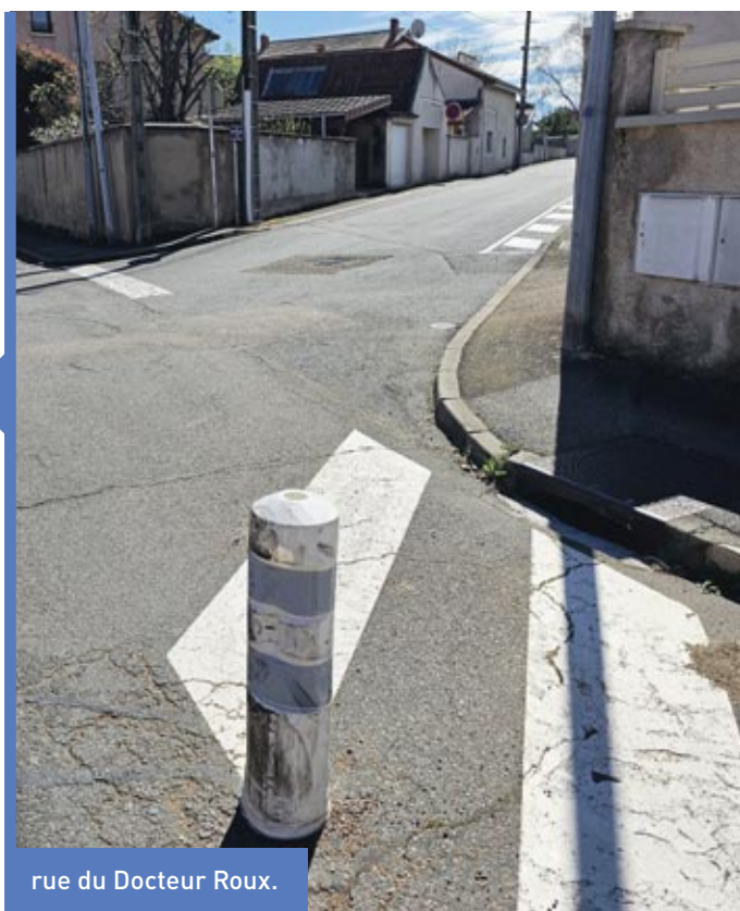
rue du Docteur Roux.